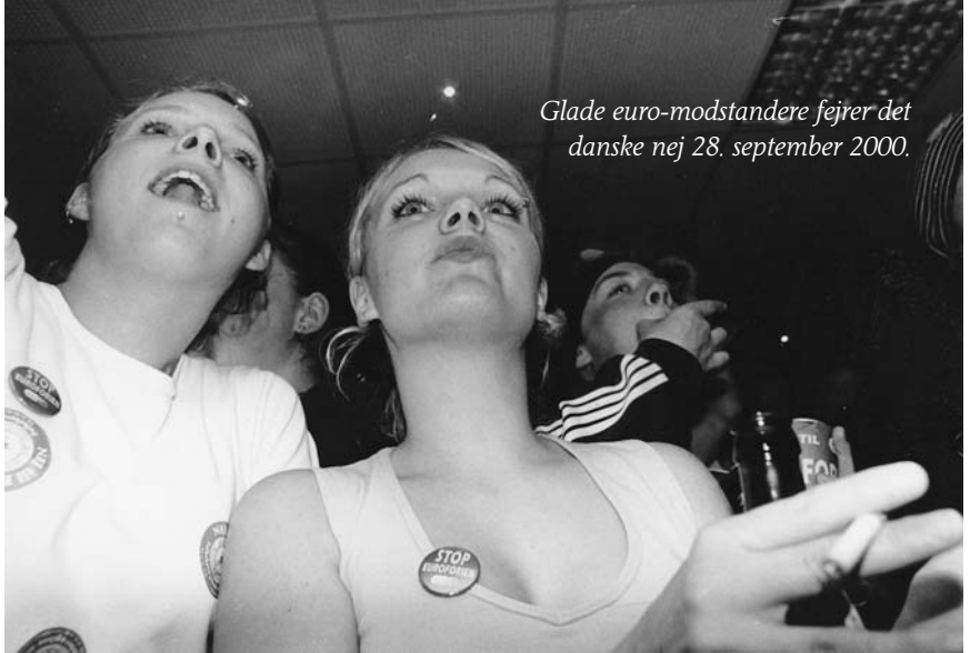
Glade euro-modstandere fejrer det danske nej 28. september 2000.